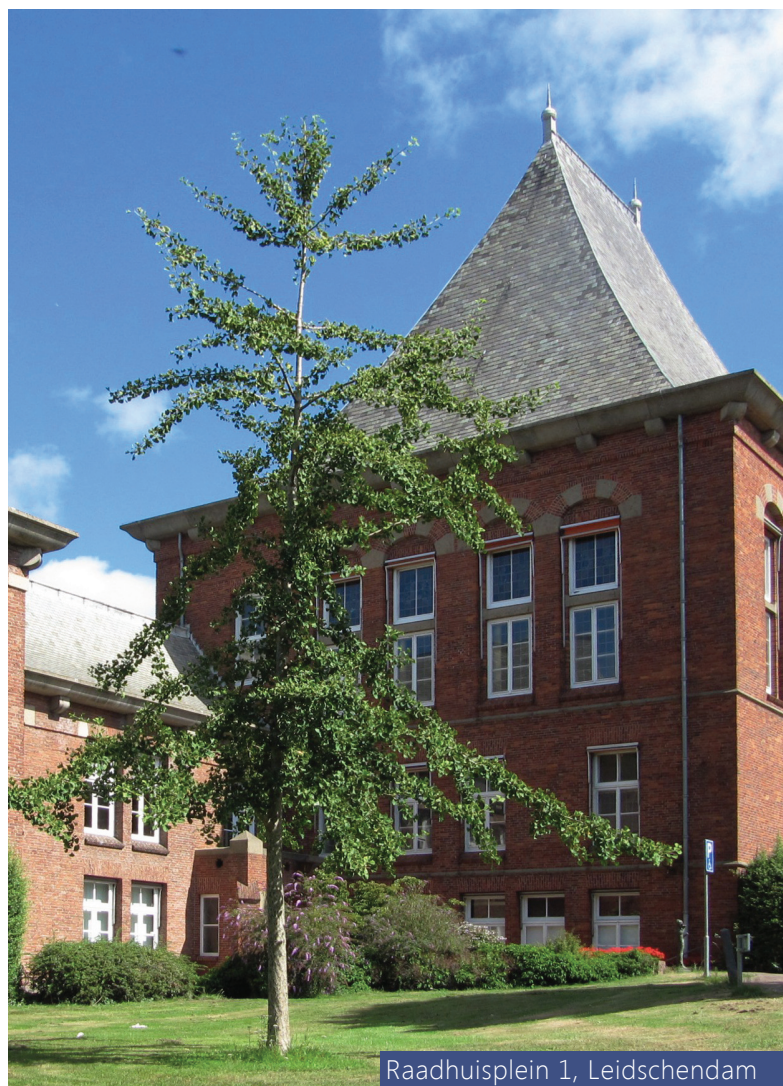
Raadhuisplein 1, Leidschendam

iGG presenteert alle resultaten in een heldere presentatie conform de gestelde eisen.