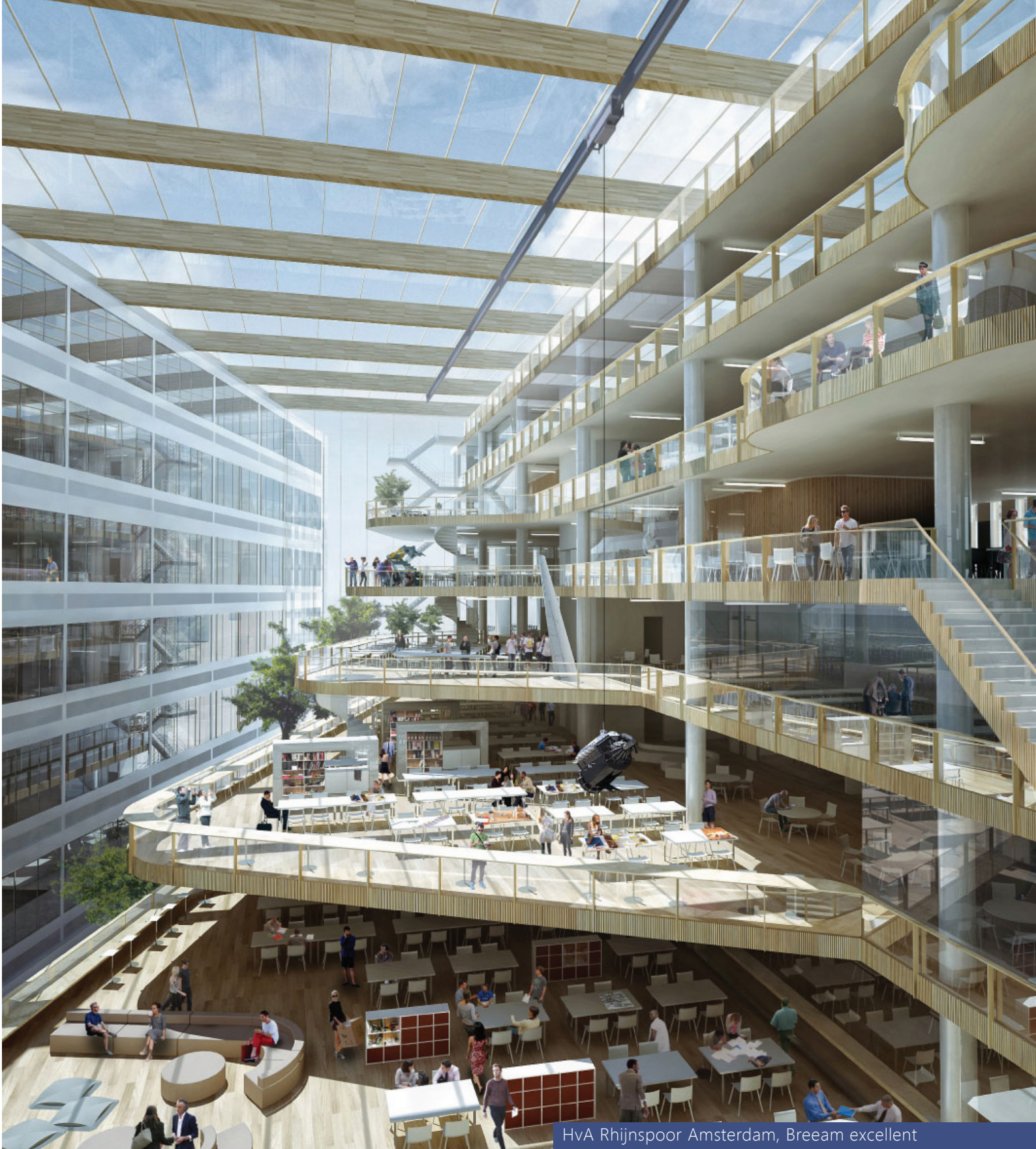
HvA Rhijnspoor Amsterdam, Breeam excellent